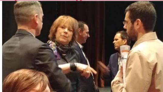
La ministre de l'éducation supérieure, Hélène David, y était pour entendre les conclusions de ce rapport!

http://eges.quebec/wp-content/uploads/2018/06/Rapport-du-collectif_EGES-5-mai-2018_final.pdf