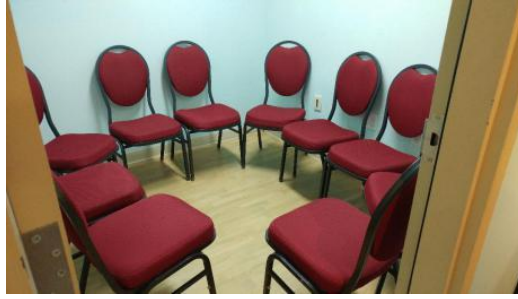
Prévision de participantEs à cet atelier