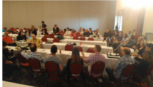
Réel des participantEs

Infolettre de la Fneeq: https://mailchi.mp/89a2bfa83591/infolettre-8-juin-2018?e=31885d49a2